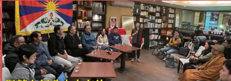
與藏人行政中央有約