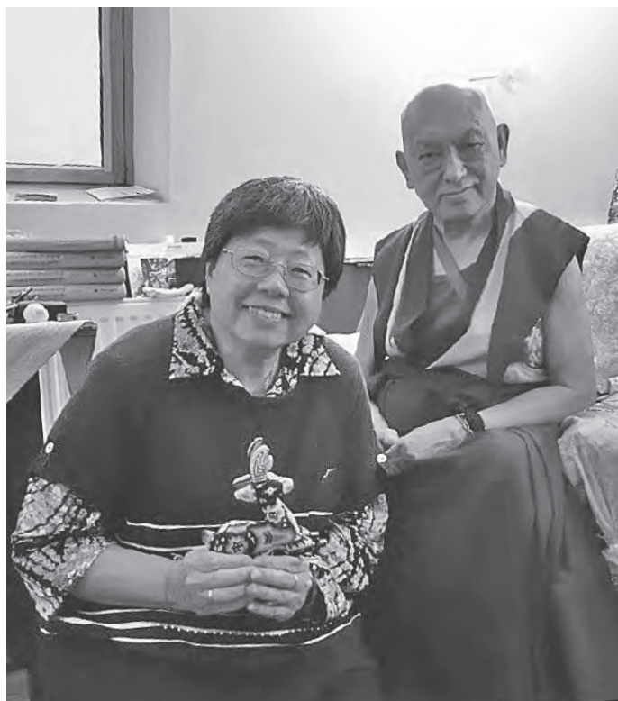
民國 108 年，仁波切在 FPMT 法國金剛瑜伽母中心帶領金剛瑜伽母閉關，6 月中閉關結束後，華人弟子於仁波切寮房晉見。我手上拿的是仁波切當天送的麋鹿玩偶。