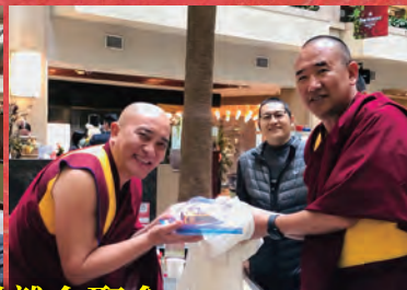
恭迎尊貴的 覺囊嘉察仁波切