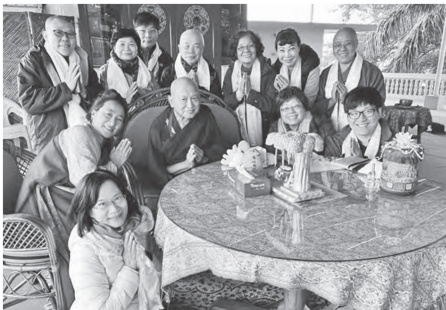
民國 108 年 12 月 31 日，印度菩提迦耶 FPMT 根院道場，仁波切住處樓頂，時任董事長（右前蹲拍第二位），為 FPMT Taiwan 祈請仁波切來台弘法。

我和師長還沒有見面，就以最快的速度確立了關係。當時，就是去承擔一個任務而已，接受任務，做自己認同的事，對我來說是很平常的。在社會上看到自己想做的很重要的事，也是直接去做，我一直就是提供服務來付出的。進一步接觸後，認同仁波切的價值觀，信任他的教導，受到仁波切照顧家人的恩惠，也相信依止上師的功德，而且我和仁波切應該有特別的因緣，教法才會特別入心，才會這麼聽他的話，別的師長叫我做的事，我未必都會做到。然後，不知道哪一天，不知道什麼時候，我的心在危難時，下意識