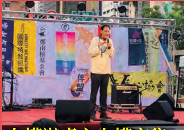
人權辦桌之人權市集