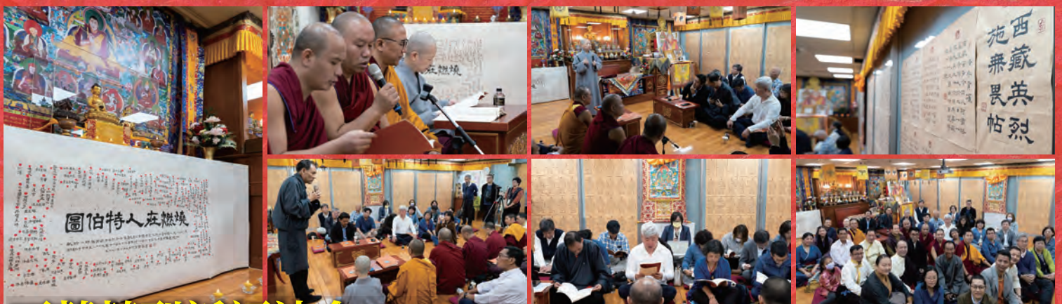
西藏英烈祈福法會 (2023/12/10)