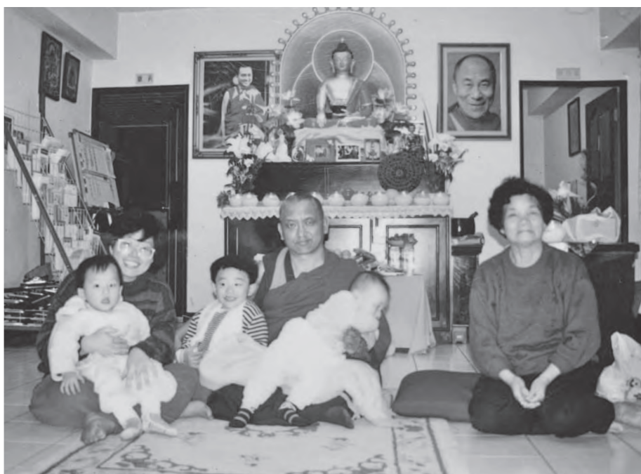
攝於民國 82 年底左右，羅斯福路經續佛法中心。我抱著次子（左 1），仁波切抱著我三歲多的長子及只有幾個月大的三子。當時身兼多職非常忙碌，我請示仁波切：「我沒有時間修行，怎麼辦？」仁波切回答：「好心最重要」，令我安心不少！

民國 83 年，FPMT Taiwan 成立基金會，我入選董事，83 年底接受仁波切指示遞任董事長，完任第一屆及第二屆，民國 88 年卸任。這段期間，我還同時是律師，是婦女救援基金會的董事長，是三個幼兒的母親，所以我都在做行政工作，很少聽課，只有仁波切來時，才會參與。我以幫助社會公益團體的心態來擔任會長和董事長，當然，仁波切教授的慈悲心，和我從事雛妓救援的動機符合，也讓我相信這是一個正信的道場，所以