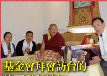
基金會拜會訪台的 格爾登仁波切