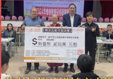
尊者杯籃球邀請賽南投開賽