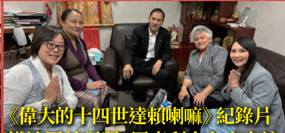
《偉大的十四世達賴喇嘛》紀錄片 導演羅絲瑪麗·羅克利夫女士來訪