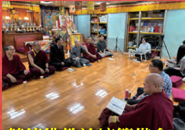
藏傳佛教論壇籌備會