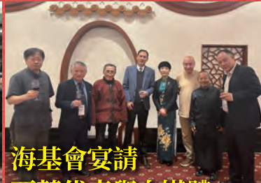
海基會宴請 西藏代表與自媒體