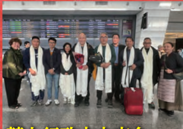
藏人行政中央來台