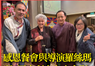
感恩餐會與導演羅絲瑪麗·羅克利夫女士合影