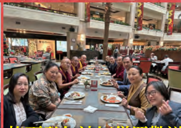
格爾登仁波切僧眾歡送離台聚會