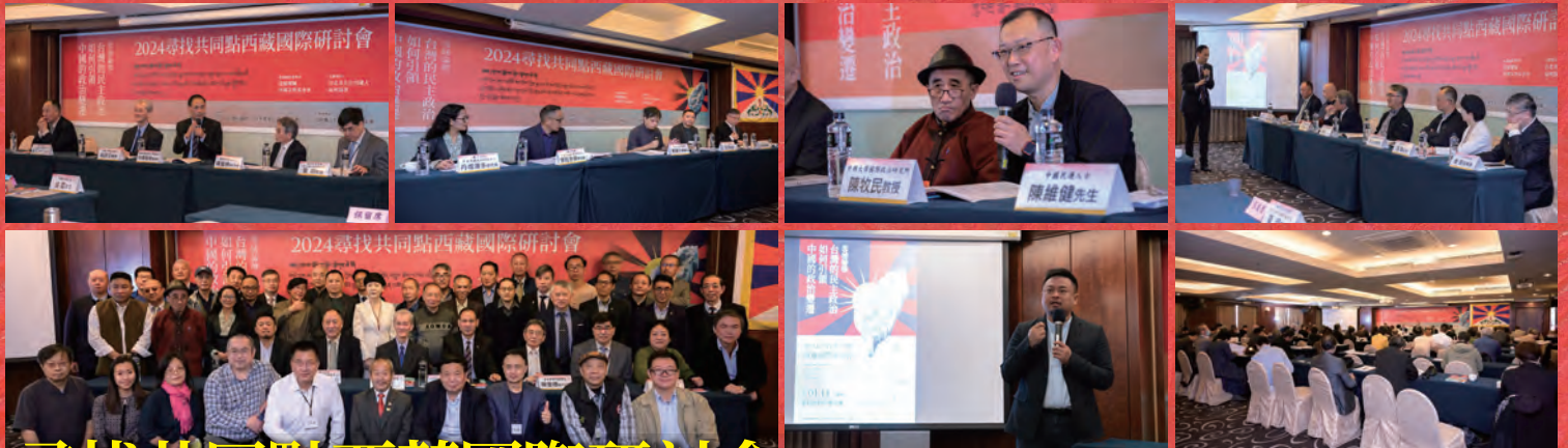
尋找共同點西藏國際研討會 (2024/1/14)