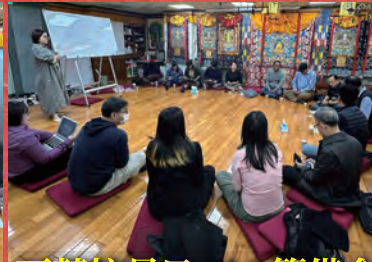
西藏抗暴日310 籌備會議