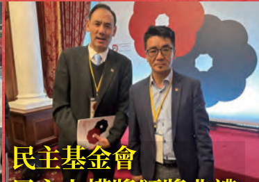
民主基金會 民主人權獎頒獎典禮