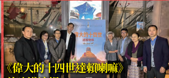
《偉大的十四世達賴喇嘛》 首映導演場