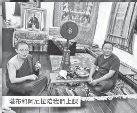
堪布和阿尼拉陪我們上課

為堪布們也都像個孩子般與我們嬉鬧，而阿尼拉也常常在一旁哈哈大笑，我想，或許我們的緣分是這樣玩出來的吧！然而，我那薄弱到不行連幼稚班程度都不到的佛法學習之路，是如此沒有系統、斷斷續續、殘破不堪地走著……因此，那次花蓮行，當阿尼拉坐在客廳如往常地和我們聊著，突如其來的這個邀約，著實嚇了我一跳！我接著問：「那…要上什麼？」嘴裡問一個，但心裡的問題蜂擁而至：「有多少人？怎麼上？在哪？要…收費嗎？」接著我才回神感到害怕和恐懼地問自己：「我？憑什麼？拿什麼教？我…什麼都不會啊？」阿尼拉笑著說：「沒有一定要上佛法啊，像是講講地球議題、全球暖化、愛護動物…都可以上啊！」就這樣，