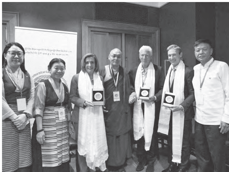
美國國會眾議院議長南希·佩洛西女士 於第八屆世界國會議員支持西藏大會開幕式上致詞