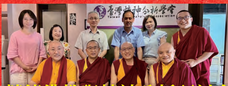
藏傳佛教與精神分析研討會 2022/7/23