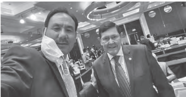
駐台代表格桑堅參先生與澳大利亞前國防部長凱文·安德魯斯先生在論壇上合影

臺灣外交部與財團法人兩岸交流遠景基金會於7月26日在台北君悅酒店舉辦「凱達格蘭論壇—駐臺灣」視訊論壇，強化合作與對話，以促進印太地區的和平、安全與繁榮。臺灣辦事處代表格桑堅參等嘉賓應邀出席論壇開幕式。