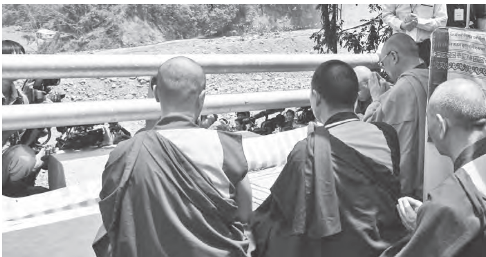
2009年8月31日，達賴喇嘛尊者抵達小林村後，面向災區現場席地而坐，為往者舉行法會

三十三年前的今天，在中國北京天安門廣場，中共動用軍警坦克殘酷鎮壓手無寸鐵的和平抗議學生，發生了震驚中外的天安門大屠殺事件。當時我在西藏，可以說也是這個事件的親歷者，那時在中國各地大學讀書的西藏三區學生、西藏本地的院校不僅踴躍參加了那場史無前例的學生運動，西藏更以寬大的胸懷接納逃難的