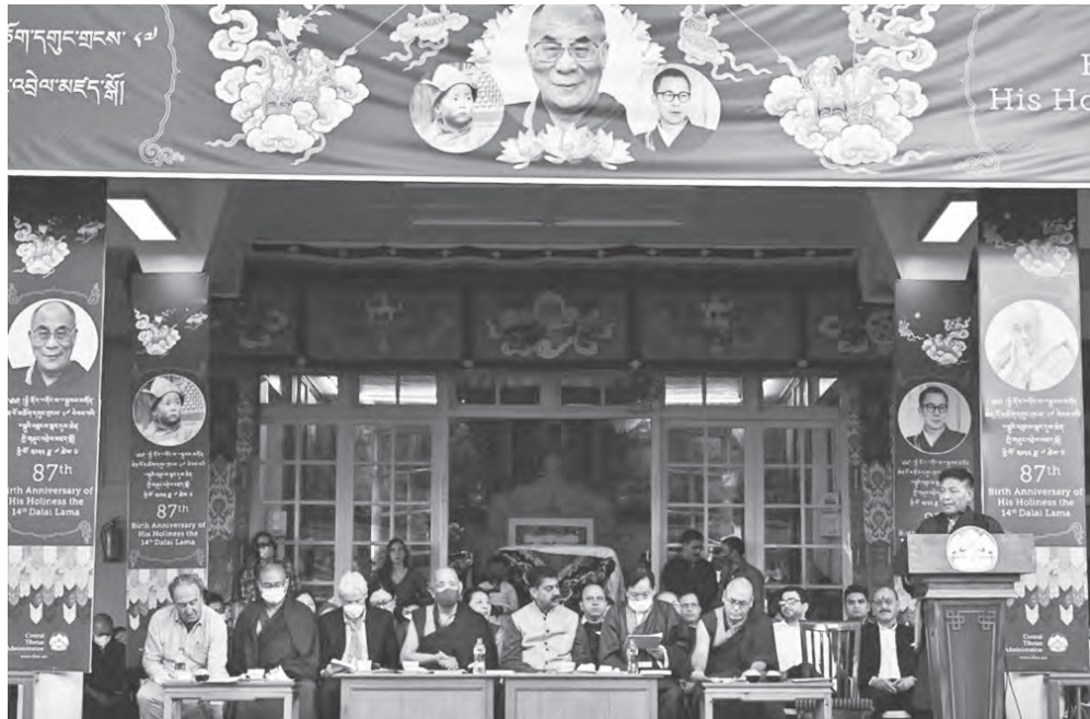
藏人行政中央隆重慶祝 達賴喇嘛尊者 87 歲華誕

人天諸有情之皈依處，西藏和西藏人民的象徵與依怙尊，遍知佛主第十四世達賴喇嘛尊者以顯示大丈夫身功德相及隨好降世於多麥宗喀，已有八十七週年的特殊時刻，噶廈代表境內外西藏人民謹以三門恭敬祝願尊者法體安康，札喜得樂！同時祈請尊者為量等虛空之無邊眾生和佛陀教法，廣續無間地廣利眾生而永住於世！