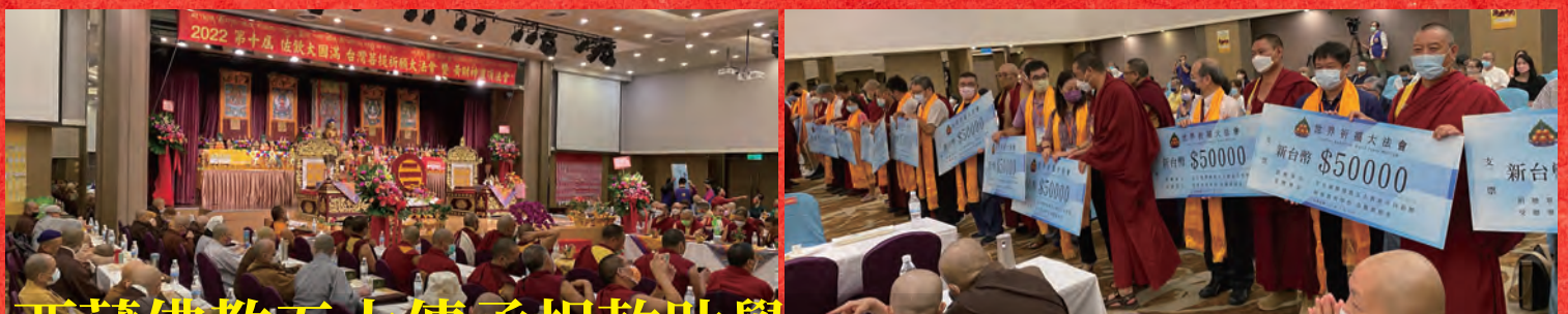
西藏佛教五大傳承捐款助學 2022/7/31