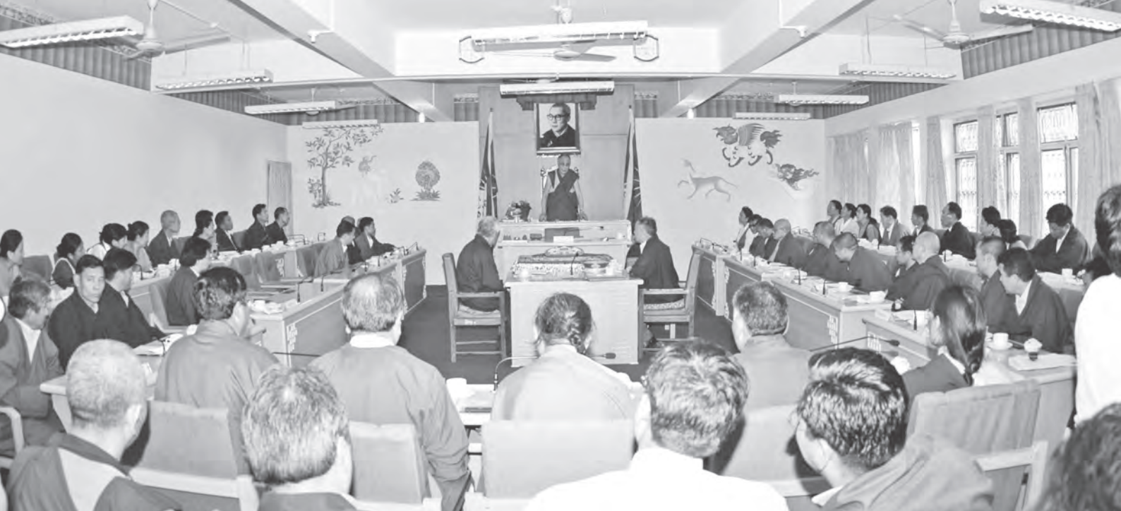
達賴喇嘛尊者親自指導推動藏人民主制度

“巴薩曲噶”時，印度政府只批准了300名出家眾名額，後來經過不斷地向有關部門申請，應承為不分教派的1500名僧侶提供條件。同時在哲霍爾地區相繼建立了上下兩所密院。但在巴薩曲噶由於環境狹小，天氣炎熱潮濕，交通不便等原因，使僧人的生存生活遇到了極大困難。西元1969年，那裡的出家眾開始遷移到各流亡藏人定居地，進而成為後續建立各教派寺院的種子。在各定居地建立起來的薩迦派、格魯派、噶舉派、寧瑪派，以及苯教寺院，不僅為弘揚佛法，而且為繼承和發揚西藏語言文化，以及在全世界對介紹西藏宗教價值觀發揮了巨大作用。