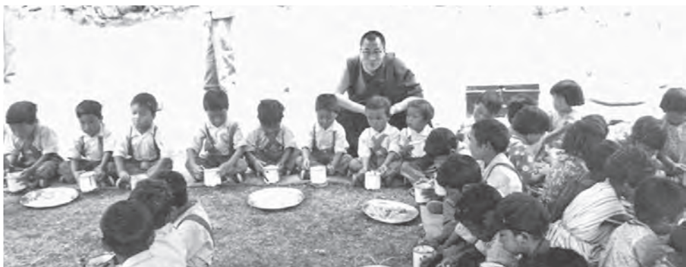
1960年，達賴喇嘛尊者探視西藏兒童村