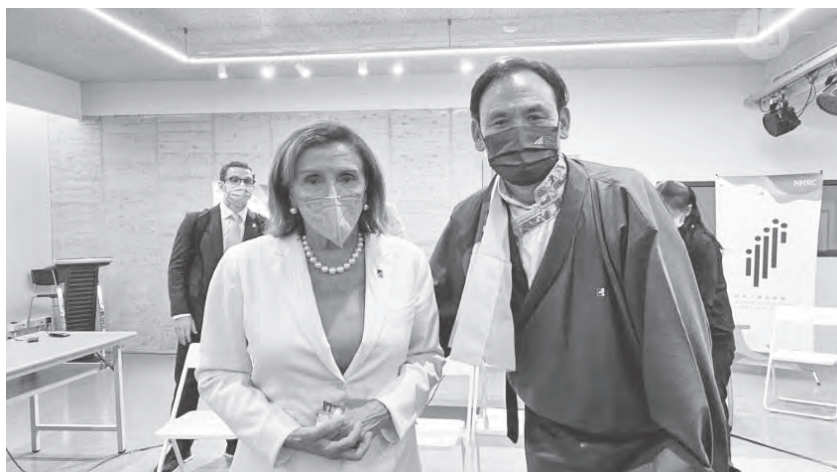
駐台代表格桑堅參與美國議會議長裴洛西於臺北人權圓桌論壇合影