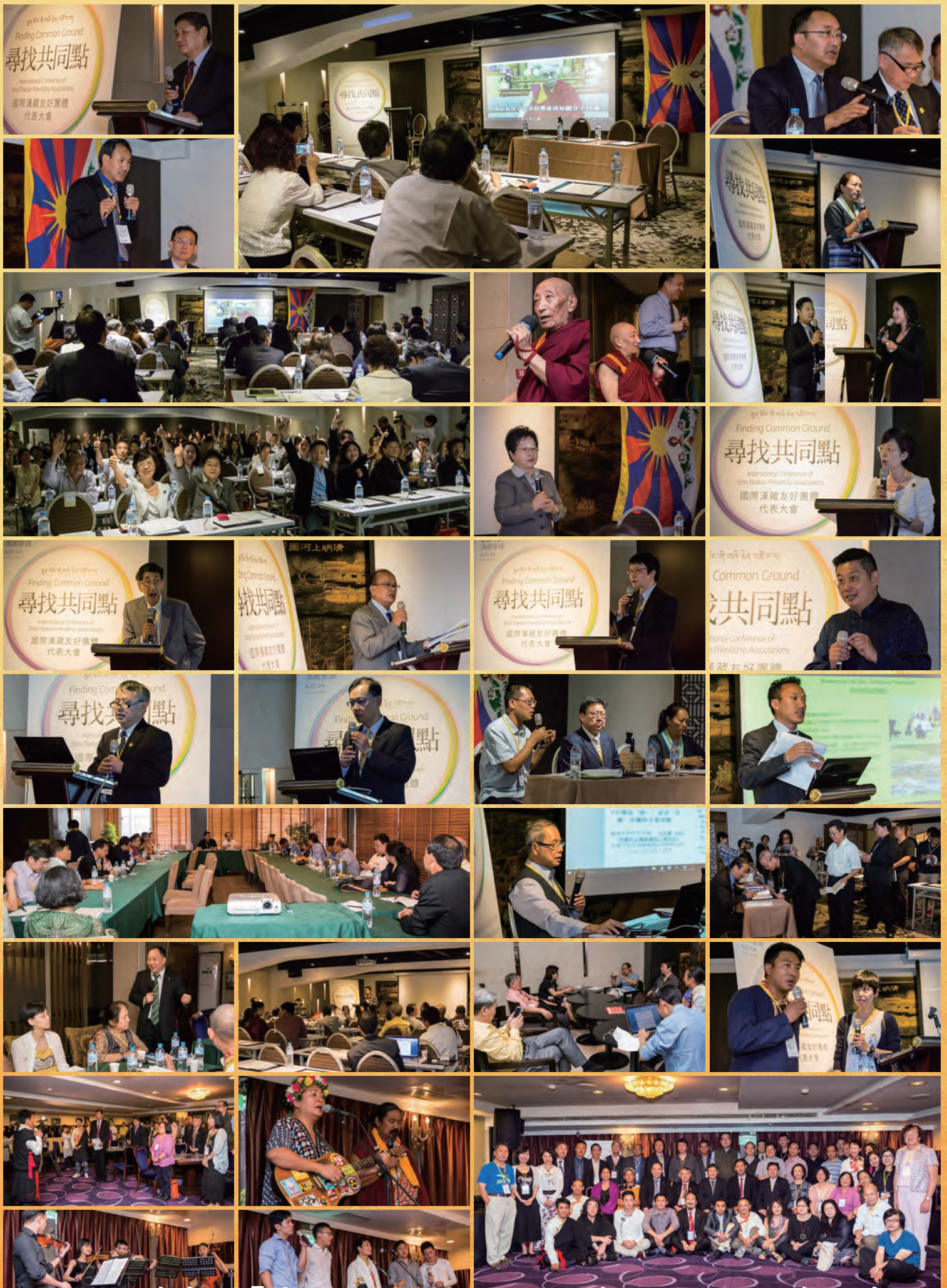
2016 漢藏會議「尋找共同點——國際漢藏友好團體代表大會」