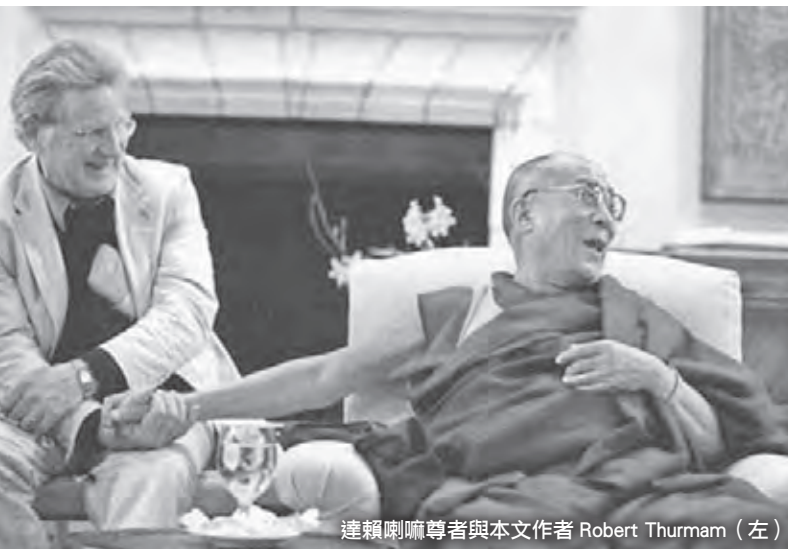
達賴喇嘛尊者與本文作者 Robert Thurman (左)